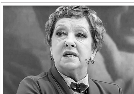
ТВ ЦЕНТР Программа «Мой герой» Гость - актриса Ольга Волкова (12+)