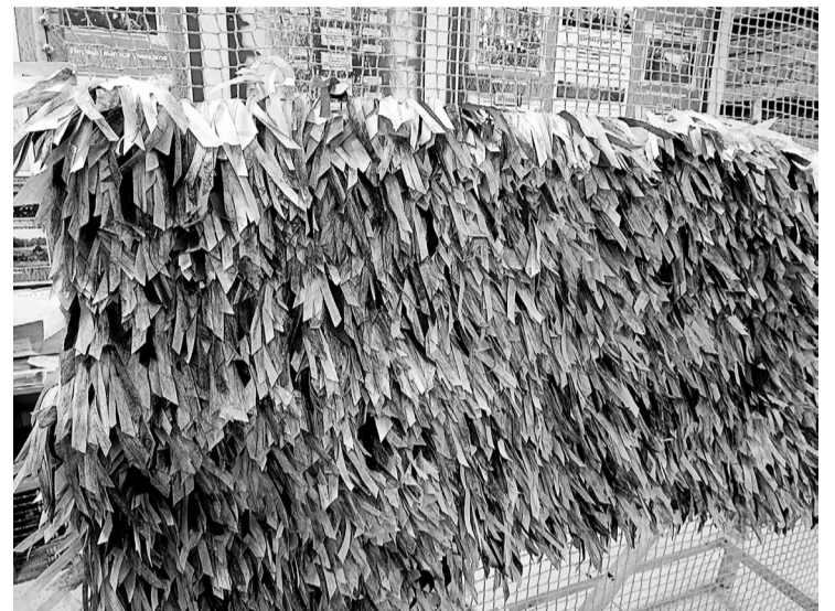
Выполняя работу, ребята посчитали: в маскировочную сеть вплетается более 6000 ленточек.