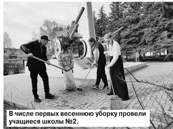
В числе первых весеннюю уборку провели учащиеся школы №2.

Информацию о проведении общегородского субботника 20 апреля Усть-Кинельское территориальное управление разместило на досках объявлений в местах массовой проходимости людей. Активность участия в субботнике зависит от сознательности самих граждан. Тех, кто следит за чистотой и благоустройством своих дворов, в нашем городском округе немало. Из года в год выходят на субботники жители улицы Селекционная: домов №№ 10, 10 «а», 11, 13 и №№ 21, 22, 23. Они подают хороший пример дружной работы по наведению чистоты и порядка там, где живут.