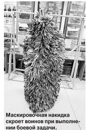
Маскировочная накидка скроет воинов при выполнении боевой задачи.

предоставили небликующий камуфляжный материал спанбонд и деревянный станок, на который натягивается сеть определенного размера. Опыт плетения маскировки девушки приобрели ранее, когда помогали устькинским волонтерам плести сети в библиотеке поселка. В отличие от сетей для укрытия боевой техники, это индивидуальное изделие предназначено для снайперов, разведчиков, штурмовиков.