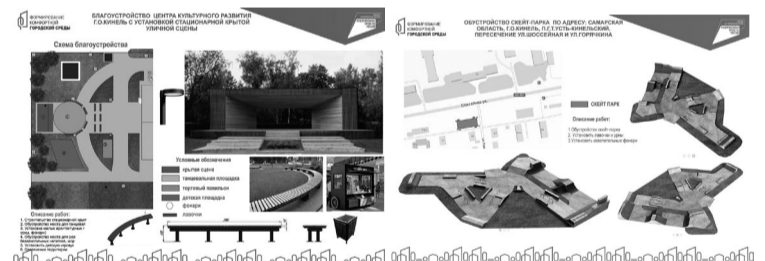
Дизайн-проекты общественных пространств представлены на платформе 63.gorodsreda.ru

Общественная территория (г. Кинель, ул. Фестивальная, д. 18, прилегающая территория к Центру культурного развития)