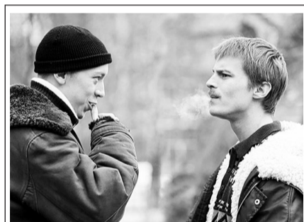
НТВ Телевизионный сериал «Слово пацана. Кровь на асфальте» (18+)

07.00 Х/ф «СЛУЧАЙ ИЗ СЛЕДСТВЕННОЙ ПРАКТИКИ» 12+ 08.30, 21.10 Календарь 12+ 09.00, 09.30, 10.00, 10.30, 11.00, 14.00, 15.00, 16.00, 19.00, 21.00 Новости 12+ 09.05, 09.35, 10.05, 10.35, 13.30, 14.10, 15.05, 19.20, 02.45 Информационно-аналит. программа «ОТражение» 12+ 11.10 Д/ц «Искусство архитектуры» 12+ 11.50 Коллеги 12+ 12.35 Новости Совета Федерации 12+ 12.50 За дело! Поговорим 12+ 16.10 Х/ф «БЕЗУМНО ВЛЮБЛЕННЫЙ» 12+ 17.50 Мультфильм 12+ 18.00 Специальный проект 12+ 18.15 Родительское собрание 12+ 21.40 Т/с «ФАЛЬШИВОМОНЕТЧИКИ» 16+ 23.25 Х/ф «ПЕРВЫЙ УЧИТЕЛЬ» 12+ 01.00 Д/ф «Дети кукурузы» 12+ 01.20 Сделано с умом 12+ 01.50 Большая страна 12+