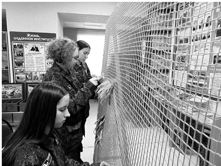
В трудоемкой работе по плетению сетей все делается вручную, но «поисковики» друг другу помощники, и дело спорится.