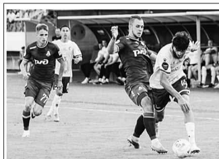
МАТЧ ТВ Футбол. Российская Премьер-Лига Обзор тура (12+)