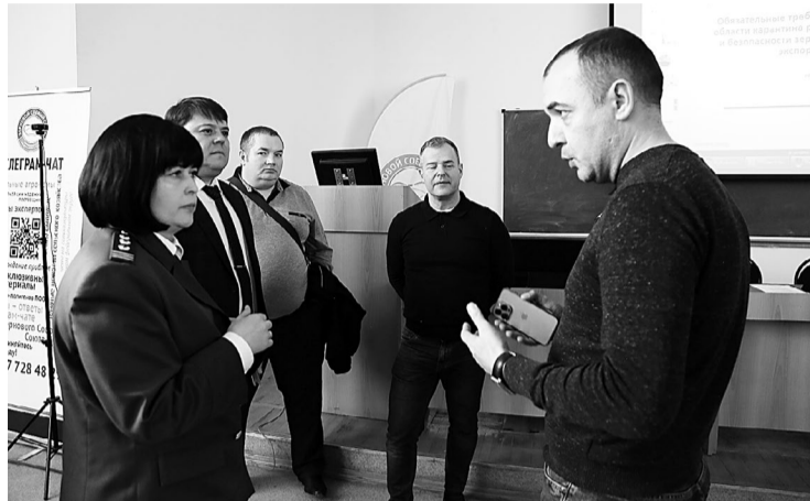
С организаторами семинара и представителями Россельхознадзора аграрии уточнили моменты по внесению данных о зерновой продукции в информационные системы.

В Самарском аграрном университете «Зерновой соевый союз Приволжского федерального округа» и «Самара - АРИС» (организация занимается дополнительным профессиональным образованием работников агропромышленного комплекса) провели семинар для сельхозпроизводителей региона. В заинтересованном диалоге подни-