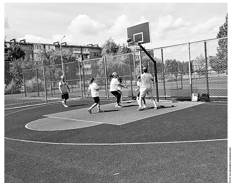
С наступлением тепла сторонников активного образа жизни на спортплощадках становится больше. После очередного этапа обновления по итогам общественного голосования на спортивном ядре Образовательного центра «Лидер» была оборудована современная зона для игры в баскетбол.