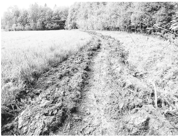
Минерализованные полосы служат противопожарным барьером для защиты от огня населенных пунктов и посевов сельхозкультур.

• Органы государственной власти, местного самоуправления, учреждения, организации, другие юридические лица независимо от своей организационно-правовой формы, руководители или владельцы крестьянских (фермерских) хозяйств, общественные объединения, индивидуальные предприниматели, должностные лица, граждане РФ, иностранные граждане, лица без гражданства, владеющие, пользующиеся и (или) распоряжающиеся территорией, прилегающей к лесу, - обеспечивают ее очистку от сухой травянистой растительности, пожнивных остатков, валежника, порубочных остатков, мусора